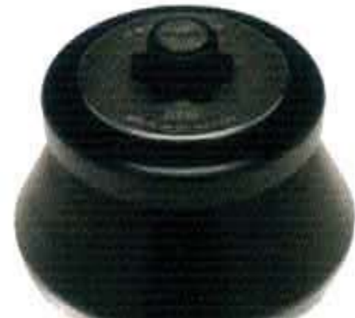
JLA-16.250 最高转速：16,000 rpm 最大相对离心力：38,420xg 最大容量：6x250mL