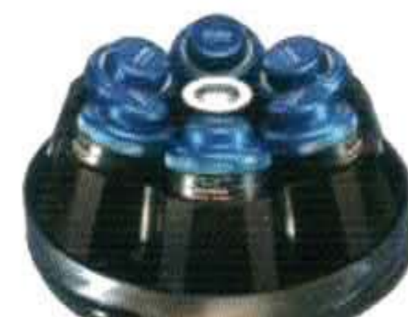
JLA-10.500 最高转速：10,000 rpm 最大相对离心力：18,600xg 最大容量：6x500mL