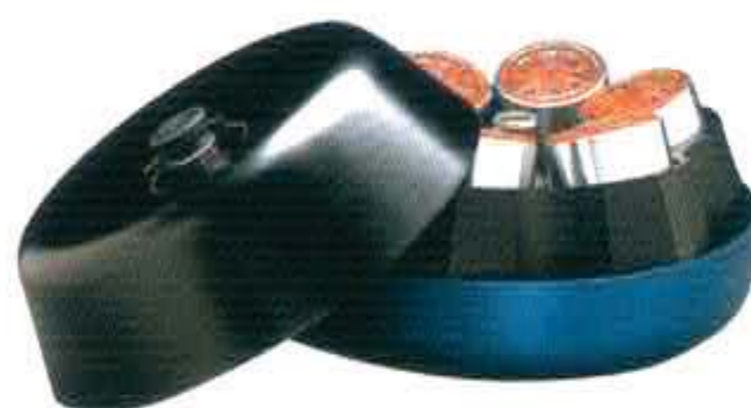
JLA-8.1000 最高转速：8,000 rpm 最大相对离心力：15,970xg 最大容量：6x1000mL