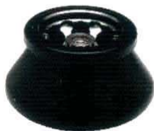
JA-25.50 最高转速：25,000 rpm 最大相对离心力：75,600xg 最大容量：8x50mL

Avanti J-26S系列高效离心机可供选择的转头多达27种，包括定角转头、水平转头、超轻转头、连续流转头和淘洗转头等，可以满足各种实验需求。