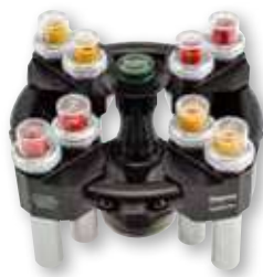
TX-100S 水平转头 带密封吊篮